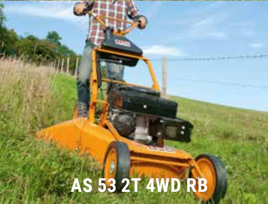
AS 53 2T 4WD RB