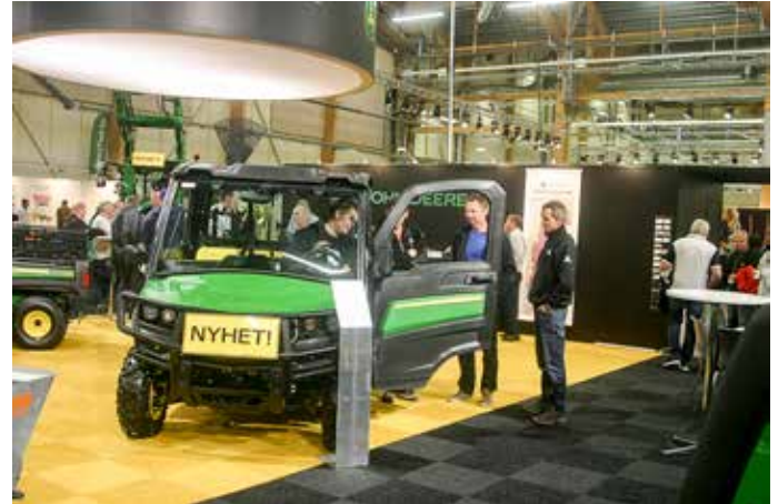
John Deere visade flera nyheter i sina montrar. Bland dem denna Gator XUV 865 M , traktorregistrerat arbetsfordon med en fyrcylindrig Yanmar diesel under huven.