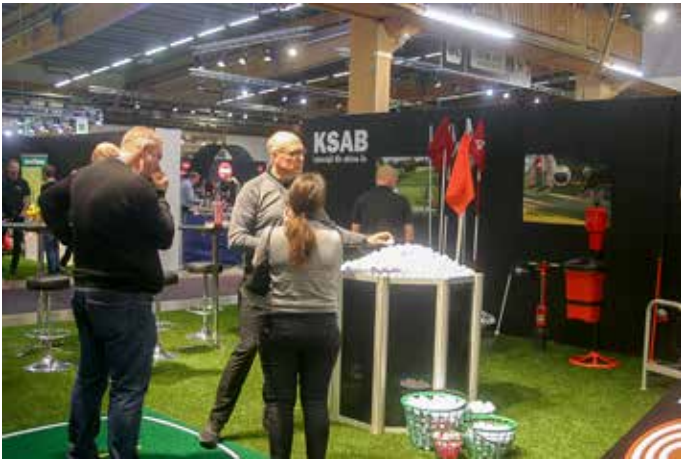
KSAB visade produkter relaterade till företagets verksamhet med utrustning till golfbanor, fotbollsplaner, kyrkogårdar och parker.