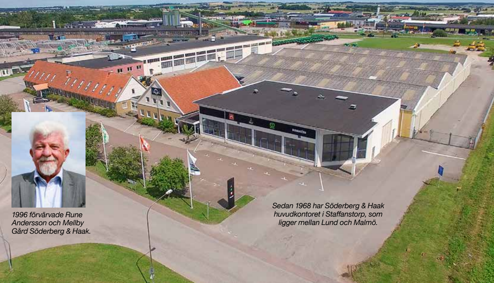
Sedan 1968 har Söderberg & Haak huvudkontoret i Staffanstorps, som ligger mellan Lund och Malmö.

faktor, men något annat är också mycket viktigt. Eskil förklarar: