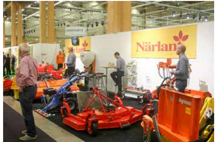
Närlant visade en del av sitt produktsortiment för besökarna under de tre mässdagarna.