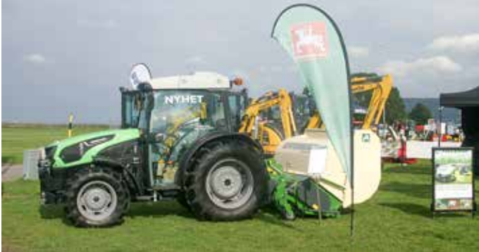
Söderberg & Haak presenterade flera nyheter, bland dessa kombinerad klipp- och uppsamlare från Amazone , här kopplad till en traktor från Deutz-Fahr .

Tongångarna var likartade från de utställare vi hann med att besöka. Här följer ett axplock av allt som presenterades i de olika montrarna, såväl ute som inne: