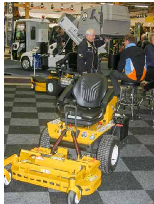
Walker presenterade flera modeller i sin inomhusmonter på mässan.