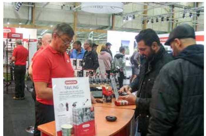
I Svenska Blounts monter kunde besökarna tävla om vem som snabbast kunde ladda deras nya trimhuvud.