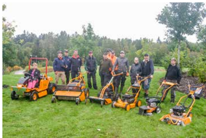
En stor del av arbetsstyrkan inom Värnamo kyrkogårdsförvaltning deltog i visningen av maskinerna från AS Motor, som marknadsförs i Sverige av Stads & Parkprodukter. Enbart positiva omdömen fölls efter provkörningarna.