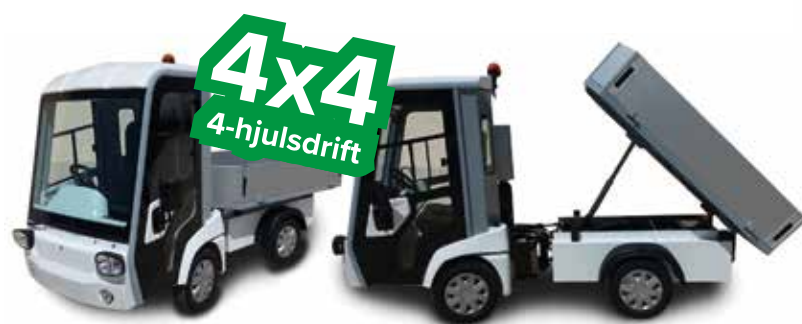
ART 4x4 Litium (Midjestyrd & 4-hjulsdrift med hög dragkapacitet)

Med litiumbatteri och en stark underhållsfri AC-motor får ni ett riktigt kraftpaket. Litiumbatterier har drygt 60% lägre vikt och 4 gånger längre livslängd än blybatterier. Vilket inte bara kommer att ge er ett av marknadens mest driftsäkra batterier, utan dessutom en lägre total milkostnad.