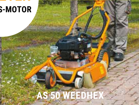
AS 50 WEEDHEX