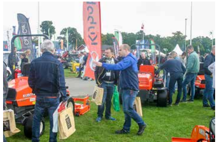
Svenningsens hade laddat upp med bland annat ett brett urval av Kubotas program.