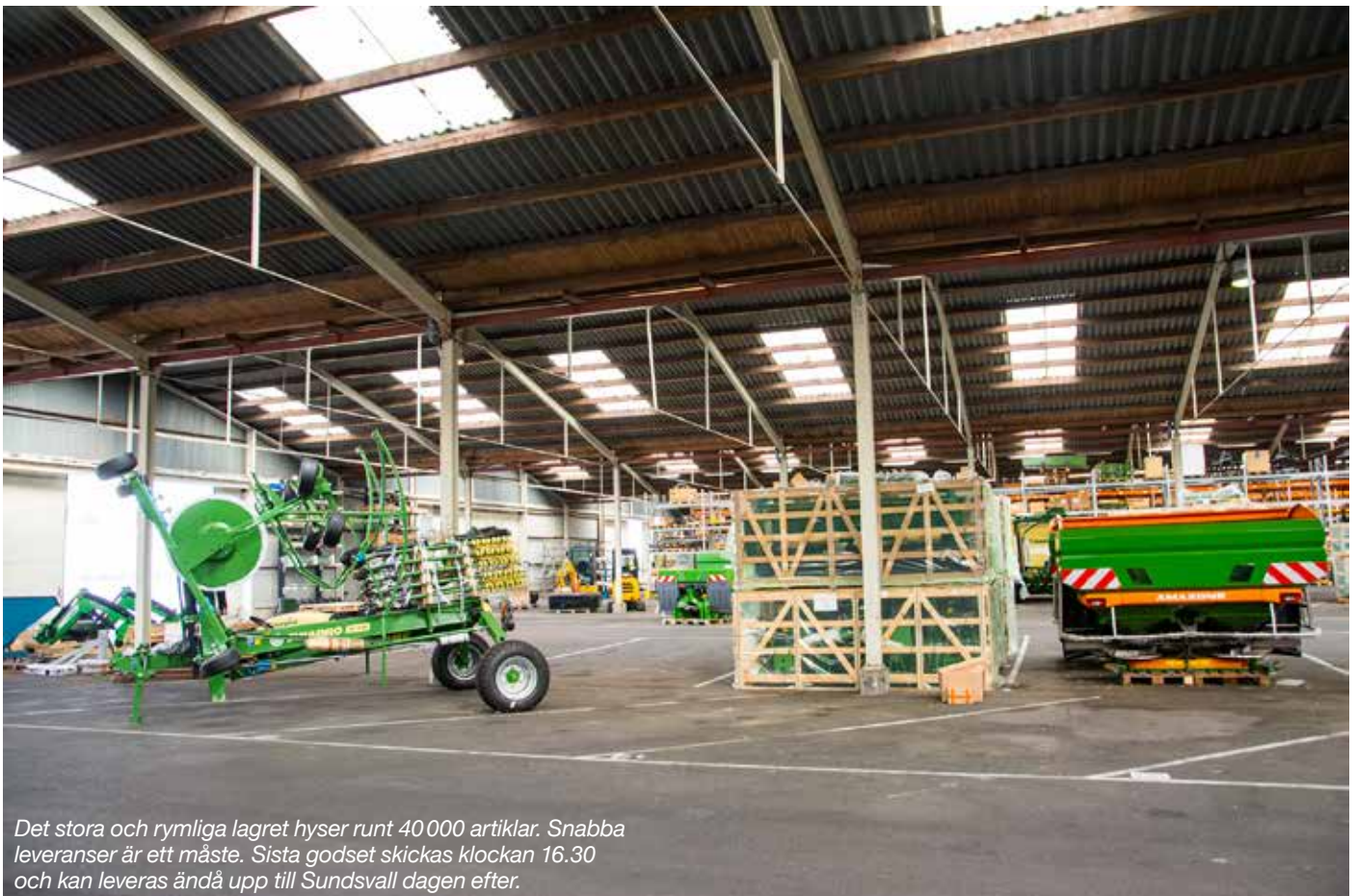
Det stora och rymliga lagret hyser runt 40 000 artiklar. Snabba leveranser är ett måste. Sista godset skickas klockan 16.30 och kan leveras ändå upp till Sundsvall dagen efter.

ett starkt försäljningsargument. Köper man en maskin av oss ingår det en leveransutbildning. ■