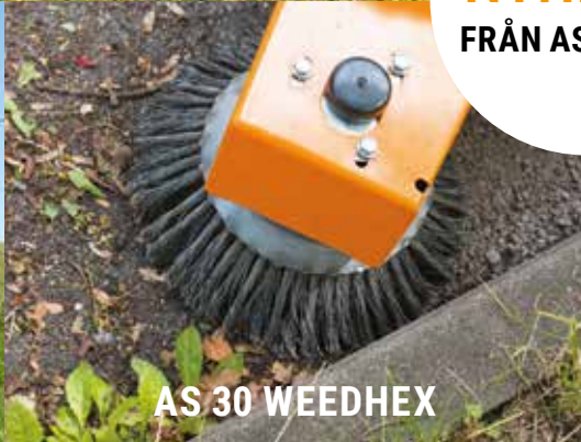
AS 30 WEEDHEX